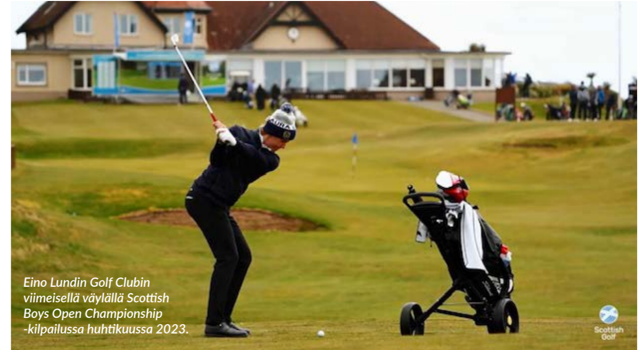
Eino Lundin Golf Clubin viimeisellä väylällä Scottish Boys Open Championship -kilpailussa huhtikuussa 2023.