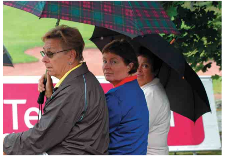
Talkoolaisia säässä kuin säässä