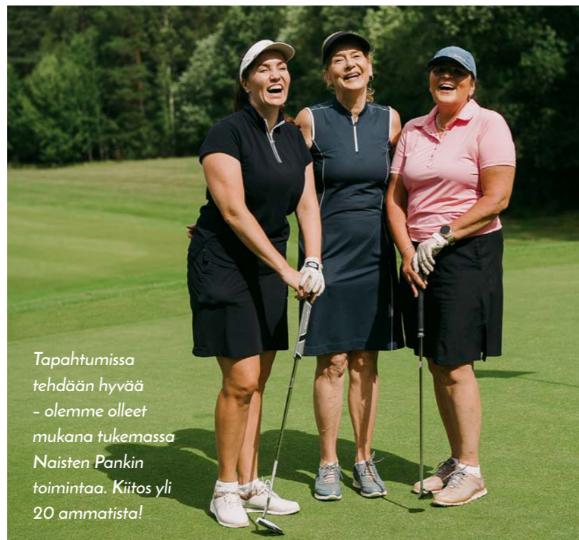
Tapahtumissa tehdään hyvää - olemme olleet mukana tukemassa Naisten Pankin toimintaa. Kiitos yli 20 ammatista!